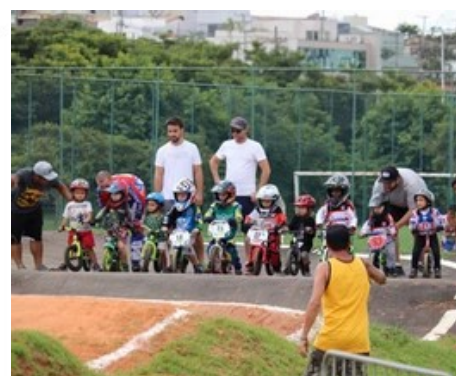
Incentivo a participação em eventos sociais e festivais.