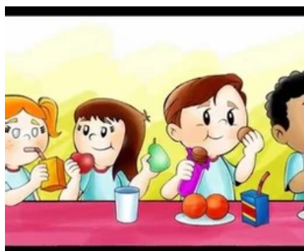
Alimentação – lanche, após as aulas.