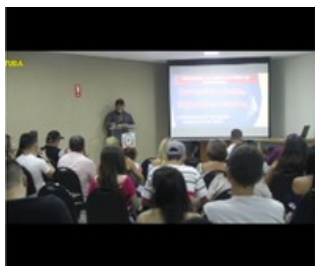
Palestras Sócio educativas.