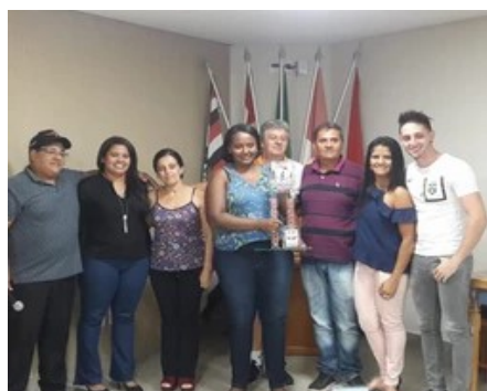
Prática do voluntariado com a participação dos pais.