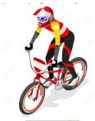
Empréstimo de bicicletas, capacete para os alunos durante as aulas, por meio de doações e campanhas de arrecadamento. As bikes são para crianças e adolescentes carentes.