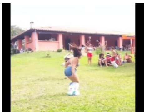
Oficinas educacionais em grupo junto a família.